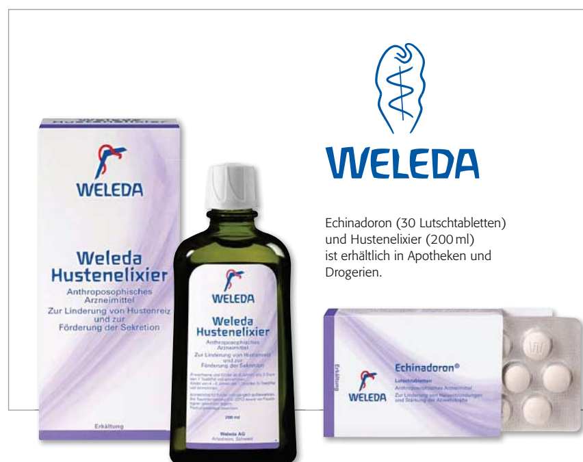
Echinadoron (30 Lutschtabletten) und Hustenelixier (200 ml) ist erhältlich in Apotheken und Drogerien.

Gute Rückmeldungen der Kundschaft haben wir von Infludo Tropfen, die das Wohlbefinden sofort erhöhen, aber auch von Sanddorn Vital Saft.