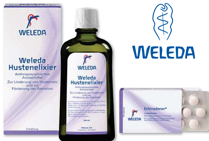
Abgabekategorie: Liste D, Zulassungsinhaber: Weleda AG, 4144 Arlesheim

Echinadoron enthält drei Heilpflanzen: Zum einen den Schmalblättrigen Sonnenhut ( Echinacea angustifolia ), der die Krankheitserreger aufspürt und unschädlich macht. Er wurde mit zwei Heilpflanzen kombiniert, die ihn unterstützen und ergänzen: die Ringelblume ( Calendula ) und die Kamille. Die Ringelblume wirkt als Vermittlerin in der Rezeptur, und die Kamille ist bekannt für ihre entzündungshemmende, wundheilende, beruhigende, aber auch immunstimulierende Wirkung.