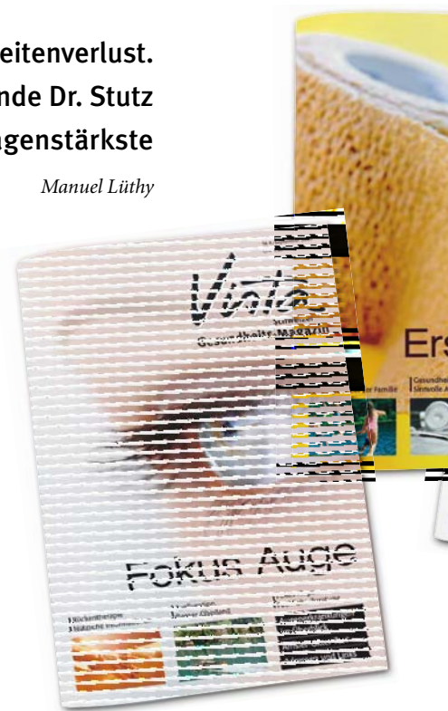
Reichweitenverluste der Gesundheits-Titel

Laut der gfs-Studie hat die Wahrnehmung der Inserate im Vista Magazin gegenüber dem Vorjahr zugenommen. Daraus resultieren vermehrt Käufe aufgrund der bestmöglich platzierten Inserate. Wie gewieft sich der Neeracher Verlag im Inseratemarkt bewegt, zeigt nicht nur der günstigste Tausender-Kontakt-Preis aller Gesundheitsmagazine. Nach der geplanten Reduktion der Auflage im September 2009 werden die Inseratepreise nach unten korrigiert werden – eine logische und kundenorientierte Massnahme, mit der sich noch manche Konkurrenten schwer tun.