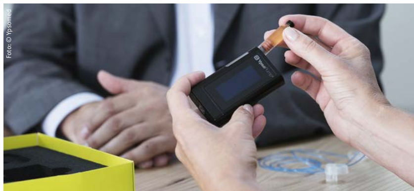
Mehr Lebensqualität für Diabetespatienten

Handliche Insulinpumpen erhöhen die Lebensqualität von Typ-1-Diabetikern, da sie auf ständige Insulinzufuhr angewiesen sind. Vom Schweizer Medizintechnik-Spezialisten Ypsomed wird derzeit ein neues, besonders kleines Modell eingeführt: die mylife™ YpsoPump® mit einem Gewicht von 83 Gramm und einer Dicke von 16 Millimetern. Freudenberg Sealing Technologies hilft in Zusammenarbeit mit dem Schmierstoffhersteller Klüber Lubrication dabei, die einwandfreie Funktion der Pumpe bis zur vorgeschriebenen Höchstlebensdauer von vier Jahren sicherzustellen, was 35 000 Betriebsstunden entspricht. Die neue Insulinpumpe wurde bereits mit zwei Designpreisen ausgezeichnet.