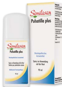
«Similasan Spray Pulsatilla plus» (catégorie de remise D)

Composition: Arnica montana D15 HAB, Calendula officinalis D10 HAB, Hepar sulfuris D12 HAB, Kalium bromatum D12 HAB, Mercurius solubilis Hahnemanni D12 HAB, Pulsatilla pratensis D15 HAB, ana partes 16,66%. Ethanolum 24% V/V.